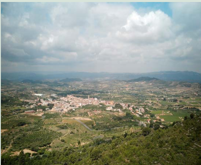
Falset, centre del govern comtal i de l'administració de l'exploració de la plata