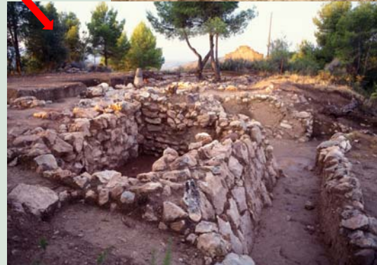
Un espai de magatzem i la primera línia de muralla (a l'extrem dret de la foto) encara en curs d'excavació