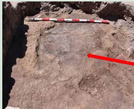
La solera d'una estructura de combustió feta d'argila (forn), tallada per l'antic dipòsit d'aigua del Molar